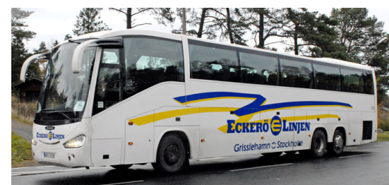
Eckerö Linjens anslutningsbuss avgår från Gate 1 .